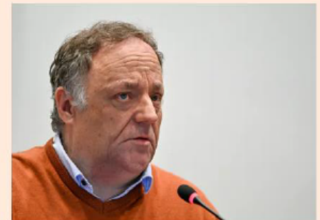
Marc Van Ranst op 21 april 2021, tijdens een hoorzitting van de bijzondere covid-commissie.

De Nederlandse inlichtingendienst AIVD uite afgelopen april de zorg dat extreemrechts en coronasceptici elkaar steeds beter weten te vinden. Zo zijn bij demonstraties tegen coronamaatregelen regelmatig ook extreemrechtse activisten betrokken. De bedreigingen waarmee Van Ranst online overstelpt wordt, komen volgens hem zeer geregeld uit extreemrechtse hoek. 'Je hoeft alleen maar naar de Twitter-bio's te kijken om te weten dat het zo is.'