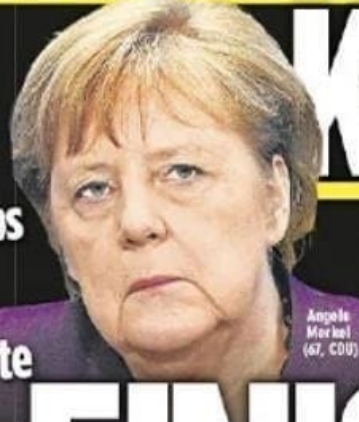
Angela Merkel (67, CDU)